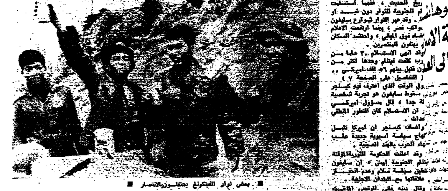
بعض نواب الفيتكونغ يحتفلون بانتصارهم

اشادت مصر وسوريا ومنظمة التحرير الفلسطينية بالنصر الذي حققته قوات فيتنام الشمالية في انتصارها على القوات الجنوبية في فيتنام الجنوبية، وقال زعيم القوات الشمالية، وان انتصار فيتنام الشمالية هو انتصار للقوى المحبة للسلام.